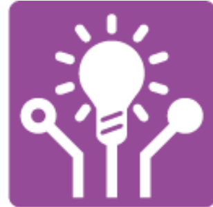
Inspirieren und Erfindergeist wecken