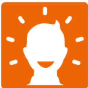
Individuelle Impulse fördern