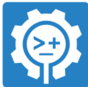
Einfache Zugänge schaffen